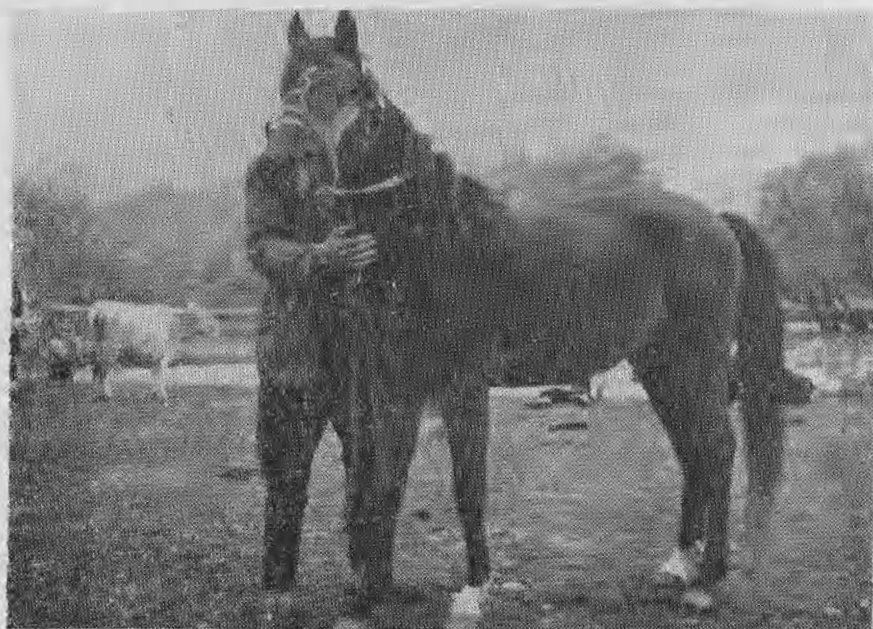
Пастух полуарапске расе, награђен Републичком наградом

Коњски материјал овдје је у расном погледу углавном изједначен. Ово су прави претставници домаћег брдског коња са незнатним траговима арапске крви, малог узраста, збијени, чврсти, кошчати, добре конституције. Женска грла у погледу узраста и кондиције била су много боља од мушких приплодних грла.